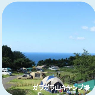
ガラガラ山キャンプ場