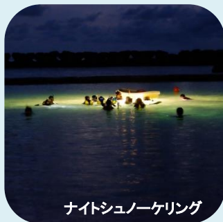
ナイトシュノーケリング

豊かな日本海の海の幸 キャンプ場でバーベキュー 釣りやガラス吹きなど体験観光も充実 ワーケーションとしての利用方法も広がります